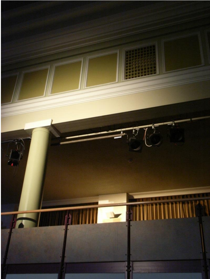
Inspizienz: Bühne links, mithören des Saaltones über die Saalsumme, ELA Künstlereinruf